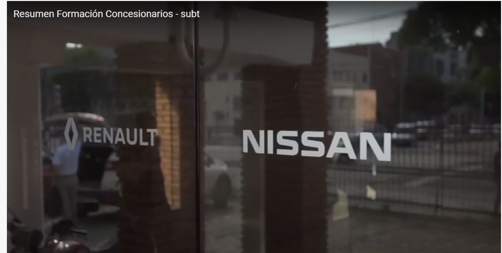
Formación concesionarios 2019